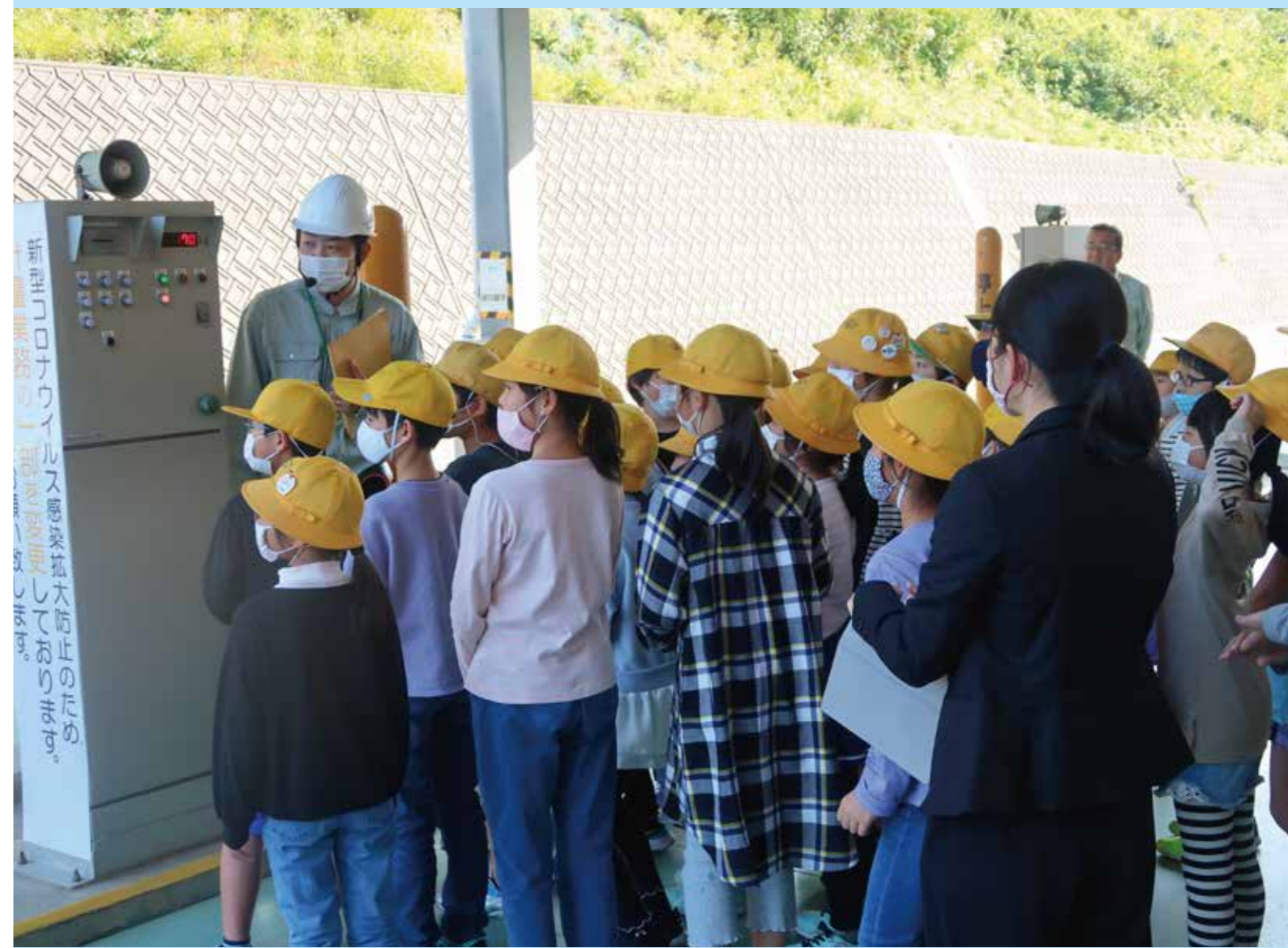
見学(若葉台小学校 10月20日)

リサイクル情報発信紙 [リファーレン・プレス] 2021. January. vol.90