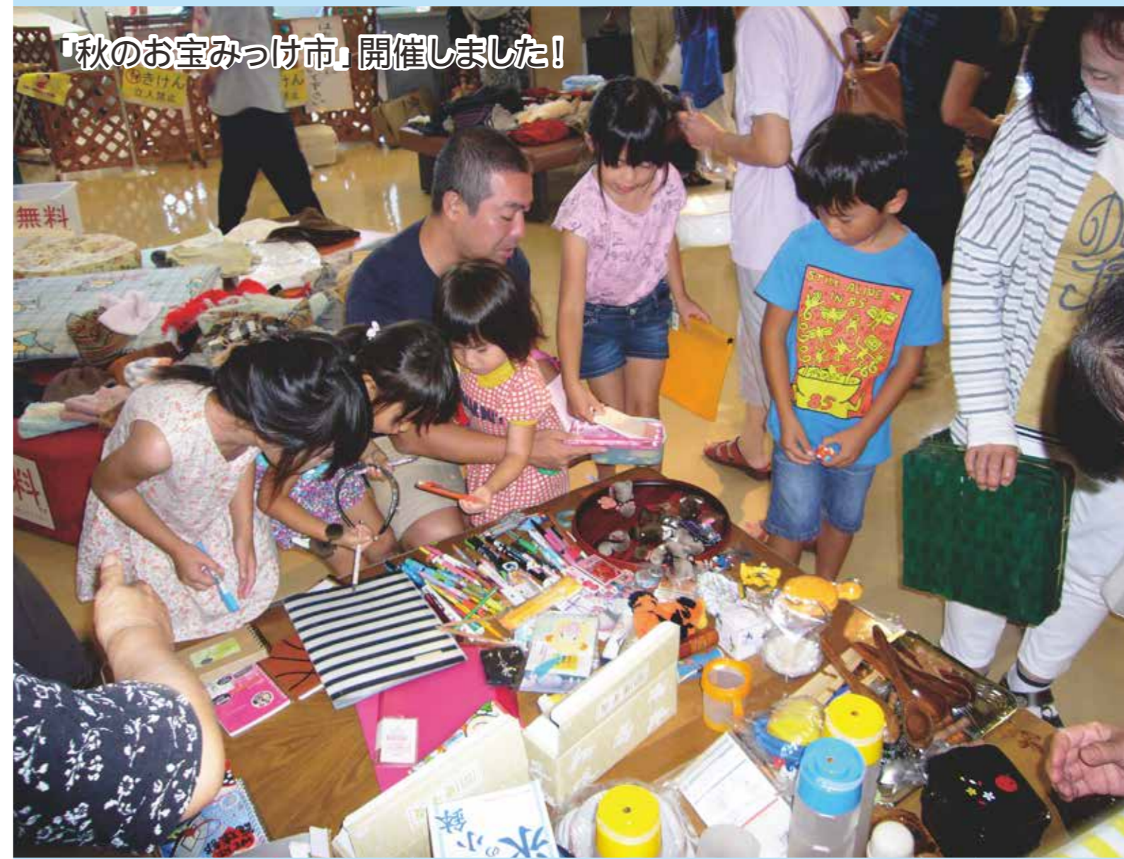
「秋のお宝みつけ市」開催しました!

リサイクル情報発信紙 [リファーレン・プレス] 2017. October. vol.77